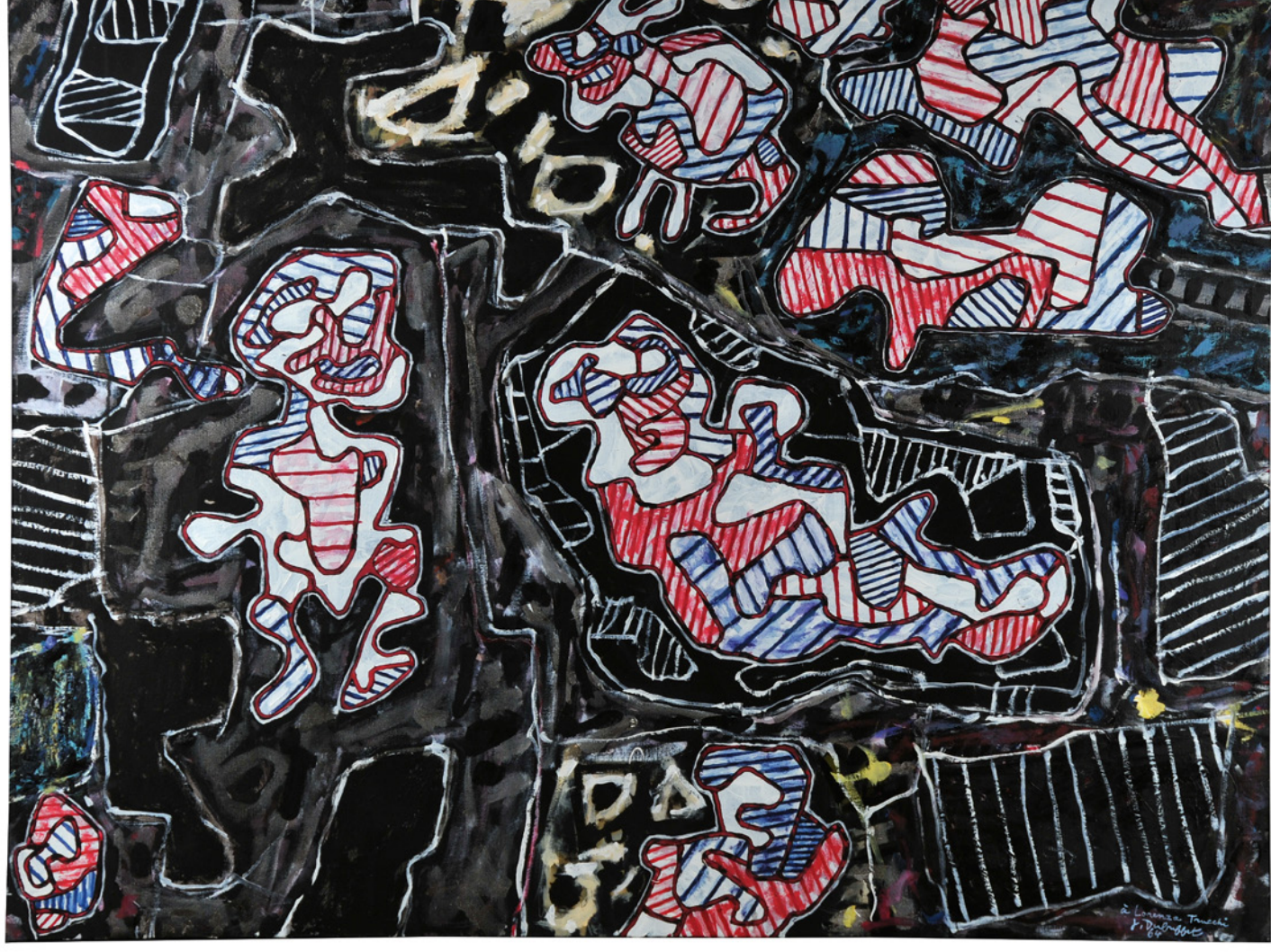
Jean Dubuffet, Vita Pastorale II , 1964. Tecnica: Olio su tela. Galleria Nazionale d'Arte Moderna e Contemporanea, Roma.